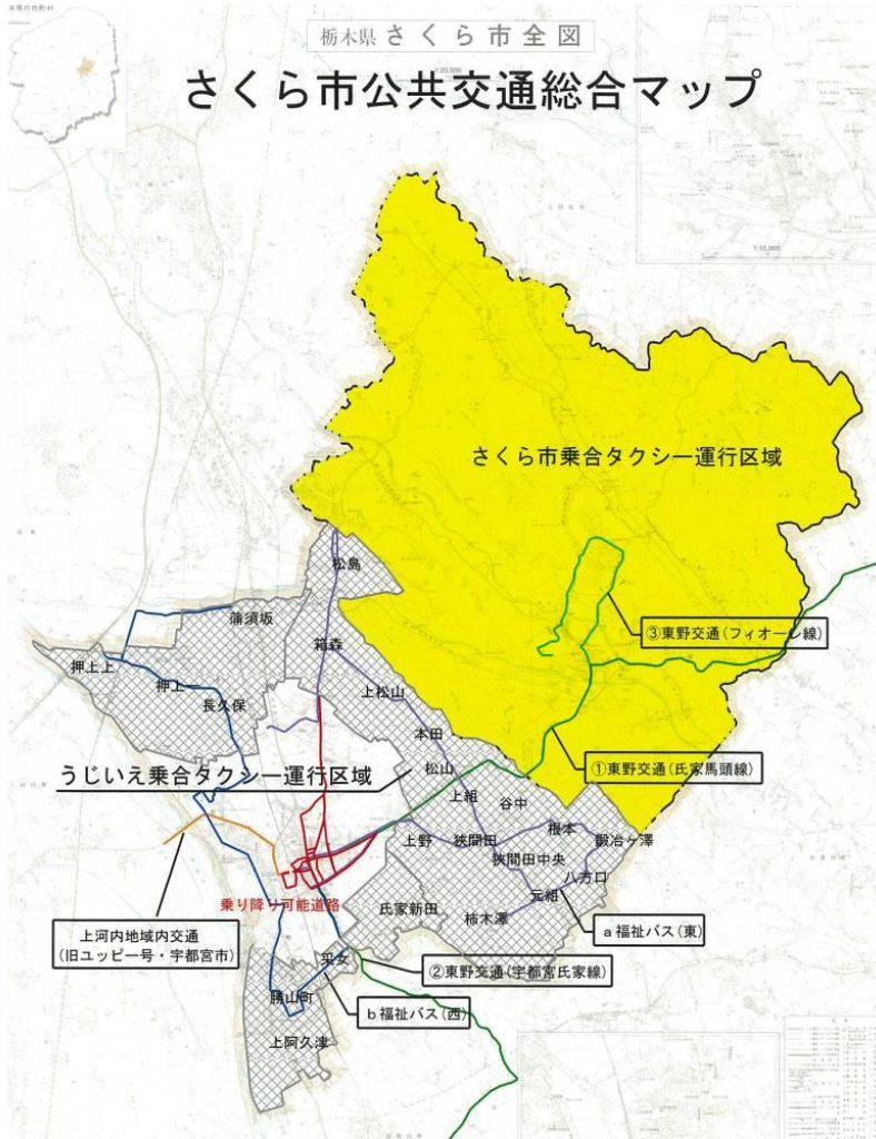
さくら市乗合タクシー 利用者・収支率(H28.10～)