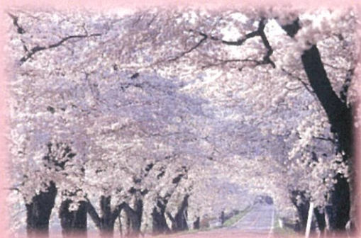
あの時は、こんなにキレイだったよね。 平成元年頃(最盛期)

9月1日から「早乙女桜並木再整備募金制度」が始まります。この制度は、現在、市と県が進めている早乙女桜並木再整備にかかる桜の植栽や景観づくり等への使途を目的としております。一定額以上の寄附者については、「新早乙女桜並木」に設置する銘板に、寄附者の名前を刻印します。未来へ引き継がれる新たなシンボルロード「新早乙女桜並木」を皆様と一緒に作っていきたく思います。ご協力をどうぞよろしくお願いいたします。