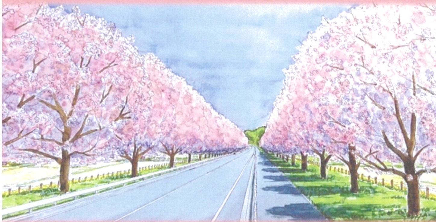
みんなの力でまた素敵な桜並木の下を通りたいね。 新早乙女桜並木イメージ