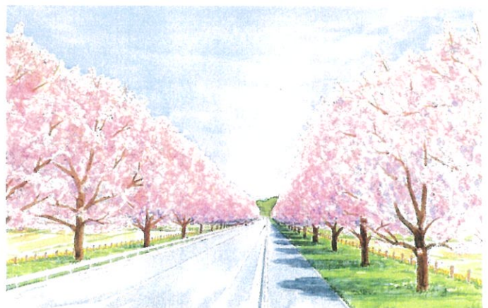
新早乙女桜並木イメージ