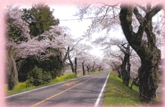
今はさびしいよね。 現在