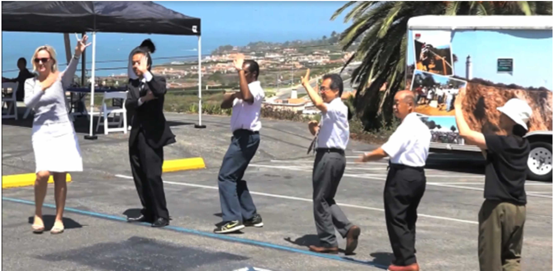
関係者による盆踊り

その後は、現地日本人による琴の演奏、アメリカンデュオによる歌の披露がおこなわれるなか、イベントに参加していた現地在住の90歳の日系の女性が、この3周年記念イベントのために作成したという小さな人形を参加者へ配り歩く場面などもあり、現地の市民からも歓迎されるイベントだということを改めて感慨深く感じる一幕であった。