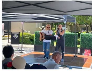
アメリカンデュオによる歌の披露