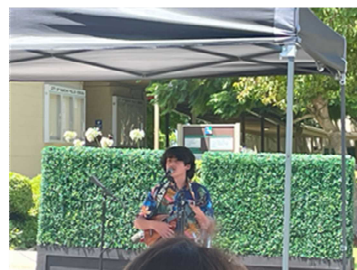
ウクレレ演奏によるパフォーマンス