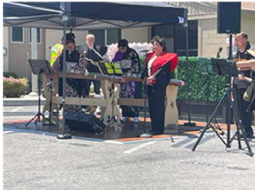
現地日本人による琴の演奏

その後は、現地日本人による琴の演奏、アメリカンデュオによる歌の披露がおこなわれるなか、イベントに参加していた現地在住の90歳の日系の女性が、この3周年記念イベントのために作成したという小さな人形を参加者へ配り歩く場面などもあり、現地の市民からも歓迎されるイベントだということを改めて感慨深く感じる一幕であった。