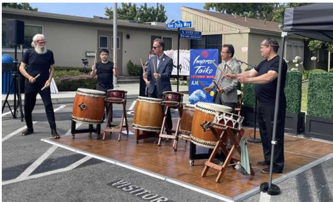
両副市長による和太鼓の演奏

現地の太鼓会によるオープニング演奏があり、双方を代表し、両市副市長が参加してのセッションが急遽行われた。