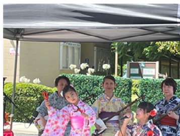
現地日本人による歌と踊り