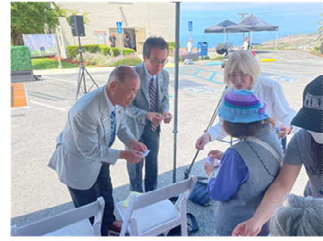
RPV 市民との交流の様子

イベントも終盤を迎えた13時頃、両市による3周年記念品の交換が行われた。さくら市からは市民団体が作成した両市の市章がプリントされたディンプルアート、RPVからは、ポイントビセンテ灯台の造形物とクジラのマークが刻印されたマグカップが贈呈された。