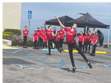
アメリカンダンス

続いてパフォーマンスが始まり、現地市民によるアメリカンダンスの披露、現地日本人による歌と踊りの披露やウクレレ奏者によるパフォーマンスが行われ、日本人の舞踊会による東京音頭の演奏時には、両市関係者がともに盆踊りに参加し交流を深めることが出来た。