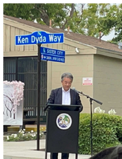
曾根在ロサンゼルス総領事挨拶

続いてパフォーマンスが始まり、現地市民によるアメリカンダンスの披露、現地日本人による歌と踊りの披露やウクレレ奏者によるパフォーマンスが行われ、日本人の舞踊会による東京音頭の演奏時には、両市関係者がともに盆踊りに参加し交流を深めることが出来た。