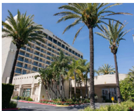
◀宿泊したダブルツリーバイヒルトン トーランスホテル