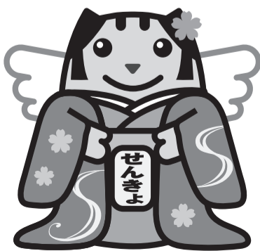
明るい選挙イメージキャラクター めいすいくん