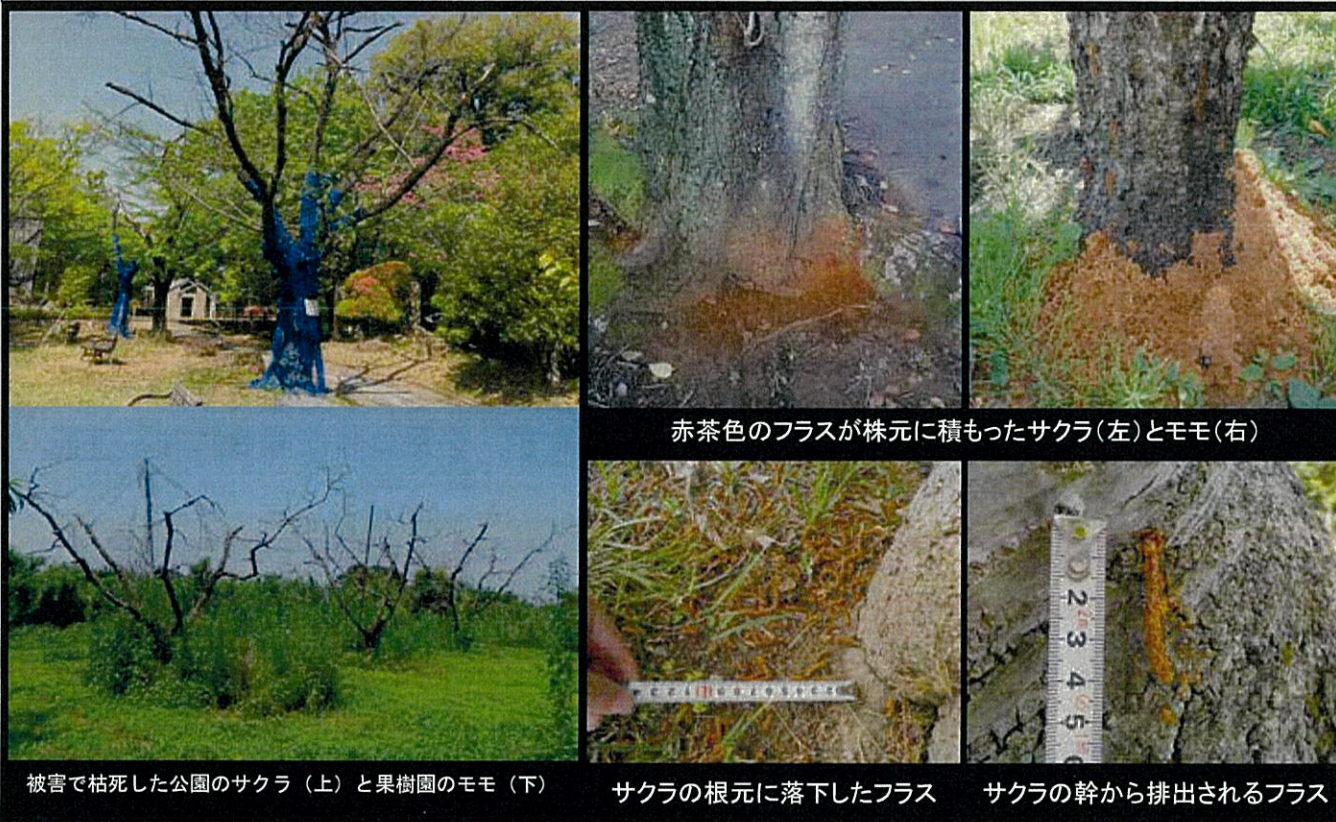
赤茶色のフラスが株元に積もったサクラ(左)とモモ(右)