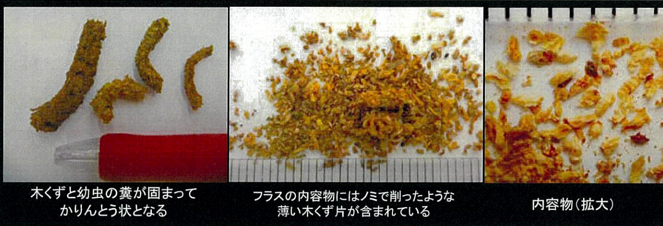
木くずと幼虫の糞が固まって かりんとう状となる