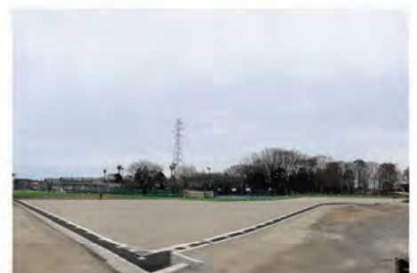
フットサル兼用テニスコート 壁打ち施設整備予定地