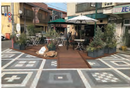
駅前のまちなかおもてなし空間 (令和2年度整備)