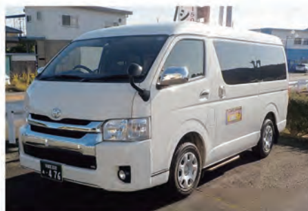
乗合タクシー事業(コンタ号)