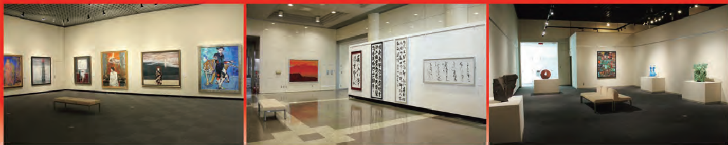
昨年度の展示風景

日展で活躍する栃木県ゆかりの作家による展覧会です。日本画・洋画・工芸美術・書の各部門にわたる力作をご覧ください。