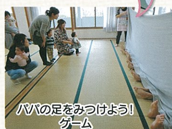
パパの足をみつけよう! ゲーム