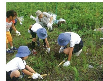
シナダレスズメガヤ抜き取り作業

まず、シルビアシジミの生活環境を守るために食草(幼虫が食べる草)のミヤコグサを増やすことにしました。国土交通省の許可を得て草川が鬼怒川に合流する付近に管理地を作りミヤコグサを移植しました。最初の年44株でしたが、現在では300株にまで増えています。また、ミヤコグサやカワラノギクのような河川敷の植物が育たない原因になっている、外来種のシナダレスズメガヤの繁殖を抑えるために多くの団体とともに抜き取り作業にも取り組んでいます。その成果もあって、最近ではその季節になるとシルビアシジミが飛び交うのを見かけるようになりました。平成16年12月にはさくら市の天然記念物にも指定されました。一方、シルビアシジミのことが一般に知られるにつれ、一部の心無いマニアによる採集が後を絶たず、これを防ぐためのパトロールも実施しています。