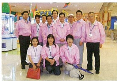
私たちがわわわ隊です