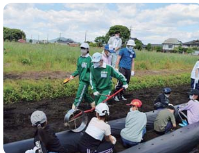
マルチに穴を開ける中学生のユースボランティア