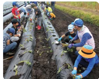
角度や向きにも注意して植付けしていきます