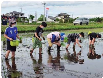
ぬかるむほ場内を慎重に進みます