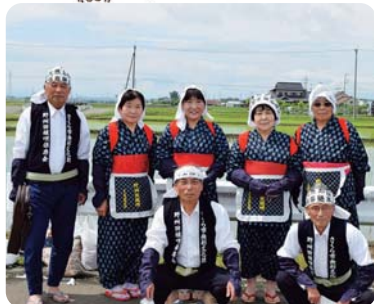
野州田植唄保存会有志の皆さん