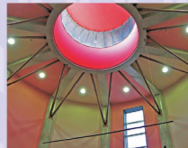
㊭吹き抜けの天井から自然光が差し込み、桜の花をイメージしたピンク色が辺りを優しく包む

エントランスから続くのはクラシックな装いのラウンジ。ゆったりくつろげるソファやハンモックなども設置され、ちょっとリッチな気分が湯上りのひと時を過ごす。