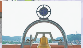
㊰鐘の近くには、願いを込めた南京錠を掛けることもできる