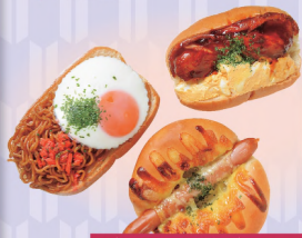
焼きそばパン (目玉焼き入り) 340円 照りたまチキン サンドパン 360円 ミートウィンナー パン 280円

丸鶏、鶏ガラ、手羽、モミジなど鶏のみで出汁をとった鶏白湯。醤油と鶏油が見事に調和した濃厚な味で、麺は細ストレート。 ⑨10時30分～17時 ⑩第2・4月曜(祝日の場合は翌日)