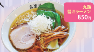
丸鶏 醤油ラーメン 850円

レストラン&食事処は、地元の人気店を集めたのが最大の特徴。ラーメン、そば・うどん、餃子、パン、たい焼、総菜・弁当、ジェラートと揃う店から、お好みの店を探してみよう。