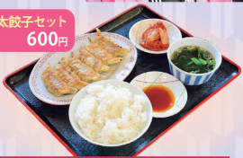
健太餃子セット 600円