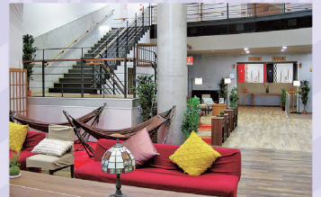
㊮浴室の入口近くにあるので、湯上りの待ち合わせにも最適だ