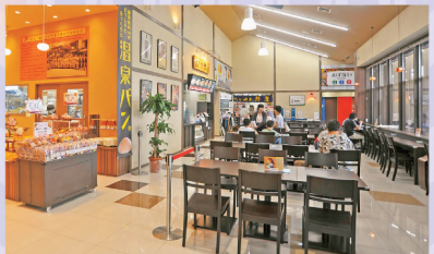
④フードコートなので、グループで利用しても好きな料理を選べる