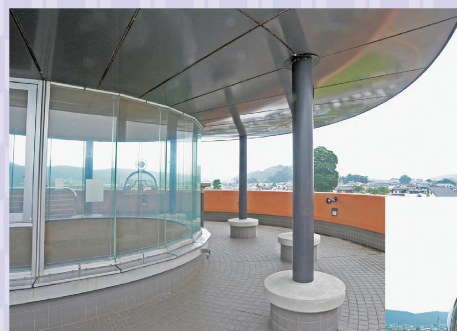
㊯喜連川の街や里山の風景を望む展望台