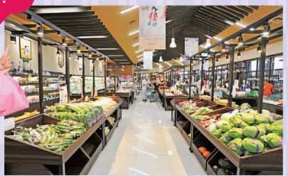
①毎朝農家から野菜や果実が届く農産品コーナー

地元のお母さんたちが手作りした総菜や弁当の店。ぬくもりを感じる家庭の味で、日替わり品も多く、毎日来る客もいるという。 ⑨9～18時⑩第2・4月曜(祝日の場合は翌日)