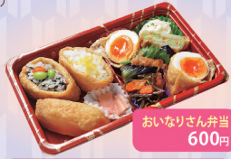
おいなりさん弁当 600円

氏家の人気店「焼肉大都」が運営。豚挽き肉と鶏挽き肉、白菜を具にした健太餃子が看板商品。キクラゲを加えた美肌餃子もある。 ⑨10～17時⑩第2・4月曜(祝日の場合は翌日)