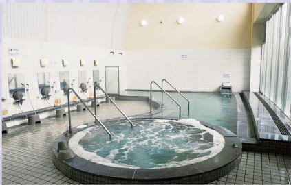
㊩和洋趣の異なる大浴場は男女日替わり