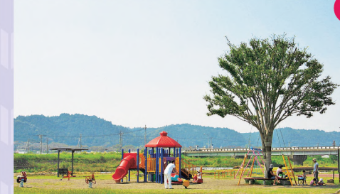
①子どもたち向けの遊具も備えている ②園内を流れる川は水深も浅く、子どもでも安心 ③8～10月には「観光ヤナ」を設置。落ち鮎は9月が狙い目