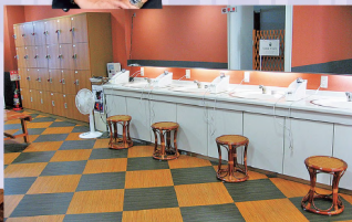
㊪2022年10月に更衣室の床や壁面をリニューアル