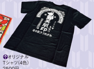
オリジナル Tシャツ(4色) 2500円