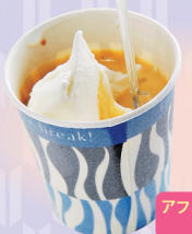
いちごマーブル 350円 (手焼きワッフルコーン プラス40円) アフオガード 450円

ロイヤルミルクティー、ヘーゼルチョコなど、個性的なジェラートが好評。エスプレッソにミルクのジェラートを入れたアフオガードは、店のイチオシ品。 ⑨9～17時⑩第2・4月曜(祝日の場合は翌日)