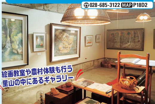
絵画教室や農村体験も行う 里山の中にあるギャラリー

大谷石造りの蔵を改装したギャラリーに水彩画作品などを展示するほか、絵画教室や周囲の環境を生かした農村体験、そば打ち体験などを行っている。体験は要予約。