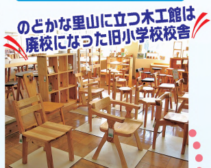
のどかな里山に立つ木工館は 廃校になった旧小学校校舎

①さくら市穂積478 ②東北自動車道矢板ICから車で26分 ③9～17時 ④月曜(祝日の場合は翌日) ⑤30台