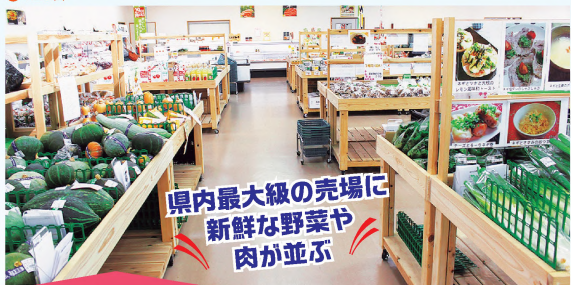
県内最大級の売場に 新鮮な野菜や肉が並ぶ

①さくら市櫻野1581 ②東北自動車道矢板ICから車で17分 ③9～17時 ④無休 ⑤120台