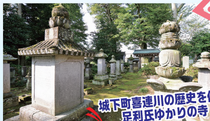
城下町喜連川の歴史を偲ぶ 足利氏ゆかりの寺

慶長6年(1601)に足利尊氏(たかうじ)の末裔である足利頼純(よりずみ)が埋葬されて以来、喜連川足利氏藩主の菩提寺となる。寺宝の足利尊氏公木像は春分・秋分の日の午前中にご開帳される。