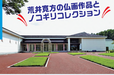
①企画展示、講座、体験学習なども開催する

①さくら市氏家1297 ②東北自動車道矢板ICから車で19分 ③入館300円(展覧会により特別料金あり) ④9~17時 ⑤月曜(祝日の場合は開館)、第3火曜、祝日の翌日(土・日曜の場合は開館)、展示替え期間 P100台