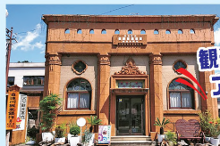
観光情報も入手できる アート展示スポット