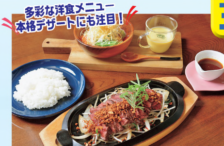
①ステーキセットは季節のサラダとポタージュ、ライス付きでコース1850円