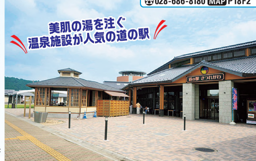
美肌の湯を注ぐ 温泉施設が人気の道の駅