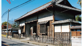
①奥州街道沿いに立つ長屋門