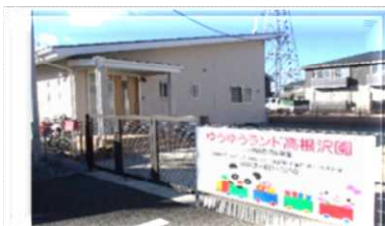
ゆうゆうランド高根沢園 住所 高根沢町光陽台 6812 TEL 028-611-1259