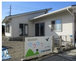
ゆうゆうランド那須烏山園 住所 那須烏山市南大和久 473-24 TEL 0287-83-8600