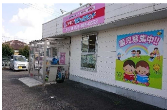
ちびっこランドさくら園 住所 さくら市櫻野 414-1 TEL 028-688-0852