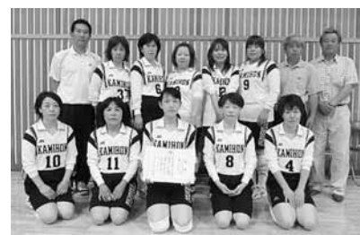
Cブロック 上松山・本田