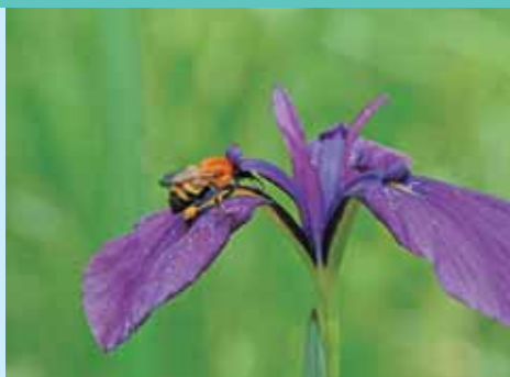
トラマルハナバチ

ハチやアリなどの小さい虫たちをマクロ撮影し、不思議な生態を記録した松田喬氏の写真展です。