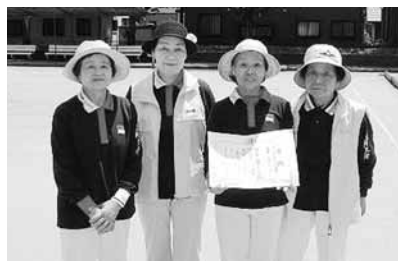
Bブロック 上阿久津