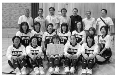
Bブロック 長久保・豊原 氏家北