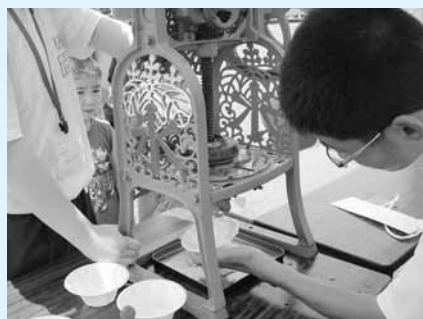
中学生も一生懸命手伝ってくれました