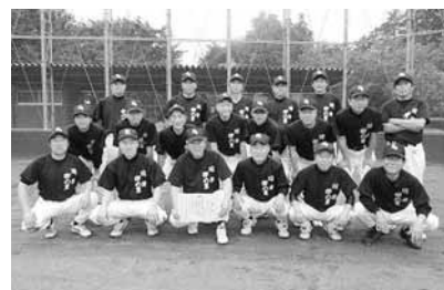
Aブロック 川岸・卯の里