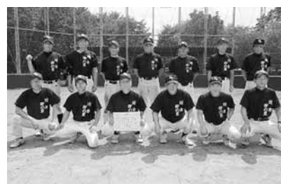
Aブロック 川岸・卯の里