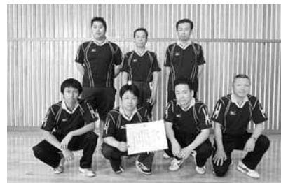
Aブロック 川岸・卯の里