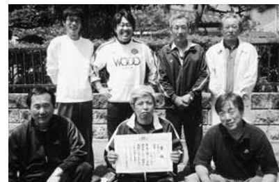
Cブロック 上松山・本田