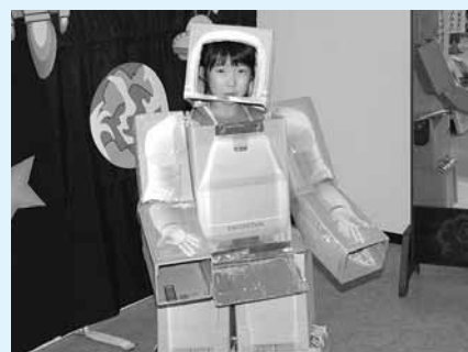
ロボットになりました