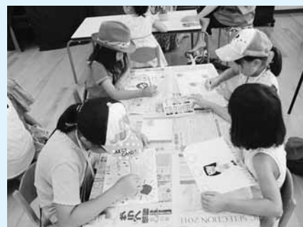
この絵を被災者に届けました