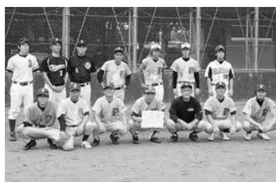
Bブロック 上阿久津