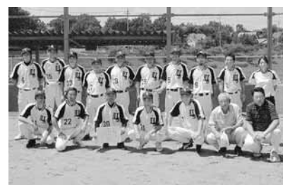
Cブロック 氏家新田