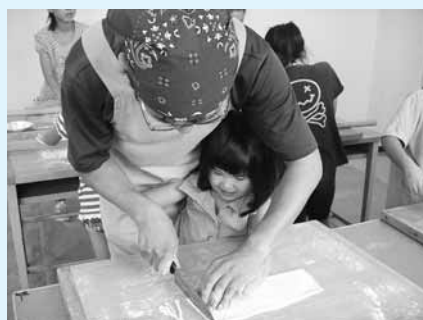
うどん作り難しかったです

「団結」をテーマにした「家族フェスタ」が、氏家公民館で開催され、約600名の親子が参加しました。今年は、被災者にエールを送ろうと、短冊にメッセージを書いたり親子で絵を描きました。これらはボランティアを通して、福島県の白河市と矢吹市に届けていただきました。