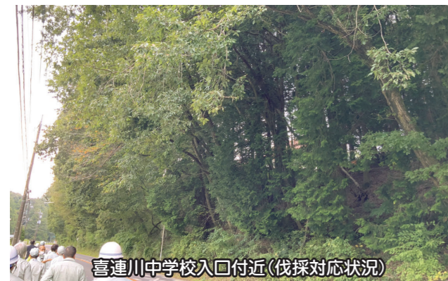
喜連川中学校入口付近(伐採対応状況)