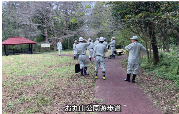
お丸山公園遊歩道