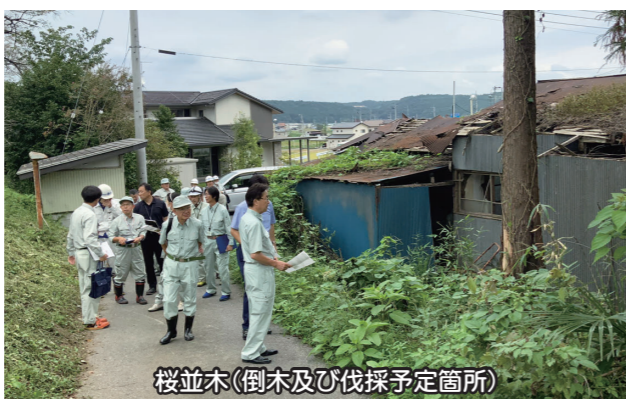
桜並木(倒木及び伐採予定箇所)