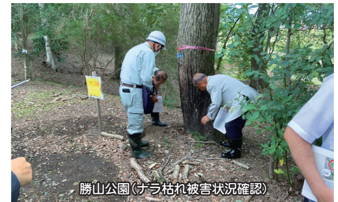
勝山公園(ナラ枯れ被害状況確認)