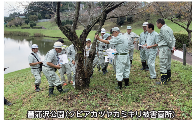
菖蒲沢公園(クビアカツヤカミキリ被害箇所)