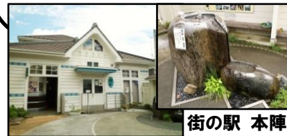
街の駅 本陣 突き抜き井戸