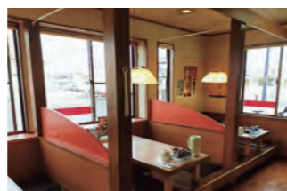
ゆったりした店内には 小上がり席・座敷も