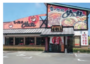
目を引く大きな看板 広い駐車場も完備