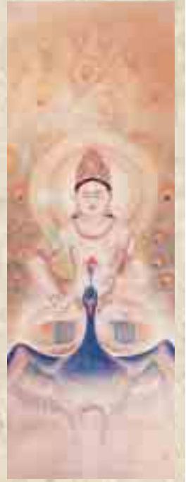
(荒井寛方「孔雀明王」)