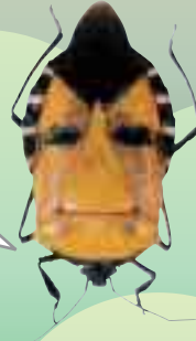
カタカトス・インカルナタス (ジンメンカメムシ)