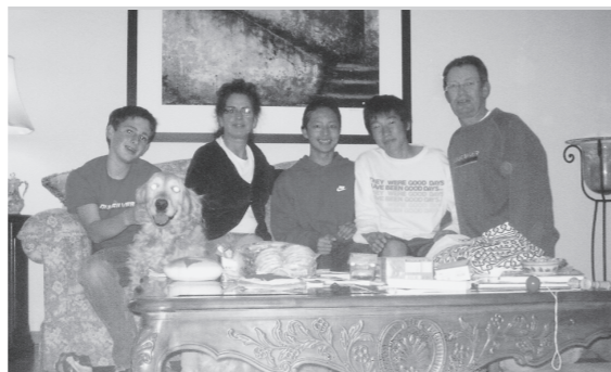
▲温かく迎えてくれたホストファミリーと

私はこの海外派遣で、ホームステイを体験させてもらいました。ホストファミリーの方々がとても優しく親切だったので、一緒に毎日を過ごすうちに私も少しずつ「優しさ」を持てるようになったと思います。あまりちゃんとした英語を話せなかったのが心残りなので、これからは今まで以上に英語の勉強に力をいれて、次回からはもっとちゃんと話せるようにしたいです。とてもよい思い出をくれたホストファミリーに心から感謝しています。