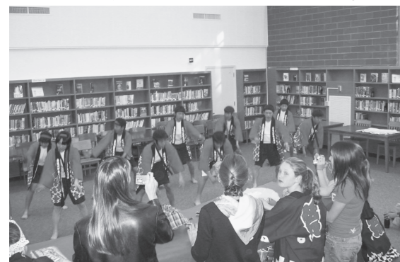
交流会ではソーランダンスを踊りました!