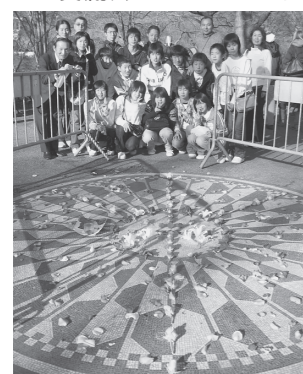
◀セントラルパークIN ニューヨーク

私はこの海外派遣を通して、アメリカのすばらしさを学ぶことができました。日本では味わうことのできない体験や、見ることのできないものなど、とても心に残ることばかりでした。この海外派遣で学んだことを忘れず、今後の生活に役立てていきたいです。そして将来、絶対もう一度アメリカに行きたいです。