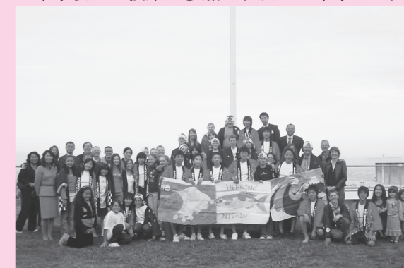
▲ホストファミリーとの集合写真

団員の皆さんは、ホストファミリーを始めとする人々の優しさに大きく心を打たれたようです。そういった素晴らしい出逢いや体験に触れ、大きく成長したことでしょう。今後の活躍に期待しています。