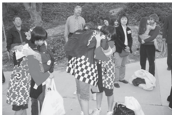
「また会おうね」とお別れしました