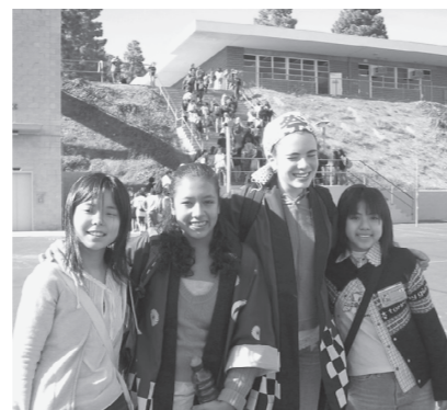
◀ロサンゼルスミラレスト中にて

海外派遣は、子どもたちが外国の風土、文化、人々とのふれあいなどを通じた異文化体験学習から、自らのよさを活かしながら学ぼうとする意欲や実践力を養うことを目的としています。また、語学力の向上と国際性豊かな感覚を身につけ、将来の地域社会の発展に貢献できる人となることも期待して実施されます。