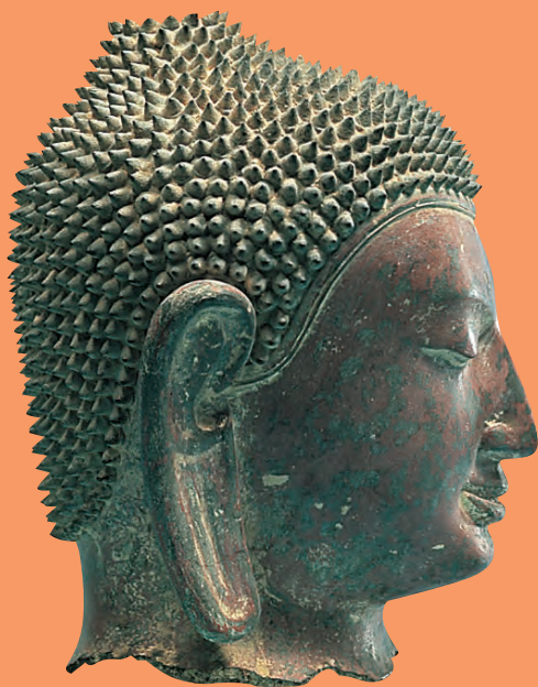
乾漆仏頭 ミャンマー 17世紀

アジア各地の民族造形を「祈り」に焦点をあてて展示しています。多種多様な民族が培ってきた伝統文化をどうぞご覧ください。