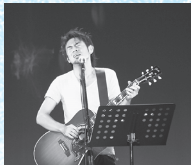
「さくら市の歌」熱唱中の河□さん