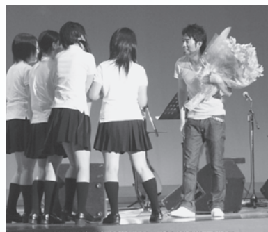
河□さんへ感謝の花束贈呈