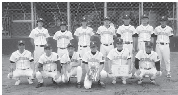
野球大会 (8月19日、26日、9月2日) 優勝 櫻野 準優勝 川岸・卯の里