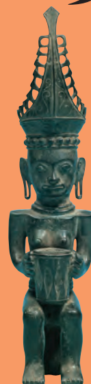
青銅太鼓を持つ女王像 インドネシア