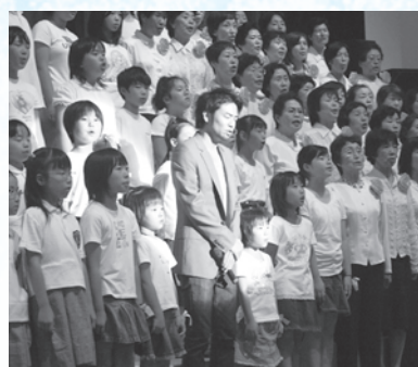
河□さんと一緒に「さくら市の歌」を大合唱