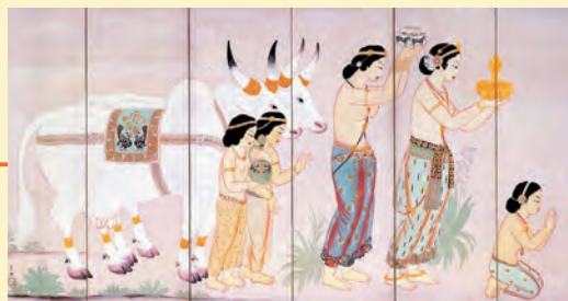
「乳糜供養」 大正4年 東京国立博物館蔵