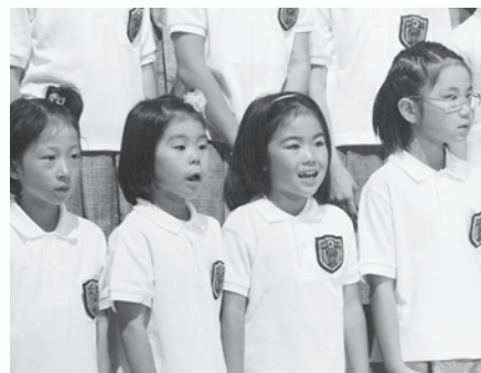
一生懸命に歌ってくれました