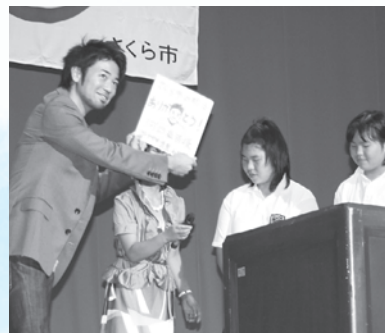
似顔絵、似てるかな？