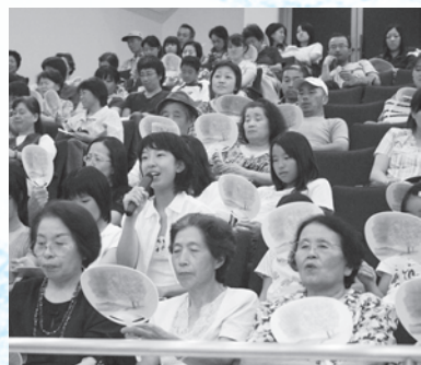
河□さんへ「さくら市に来たのは何回目ですか？」と質問