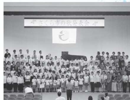
リハーサルから真剣そのものです