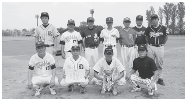
職域ソフトボール (9月8日、9日) 優勝 さくら市役所 準優勝 JAしおのや