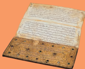
金彩唐草文経典 タイ