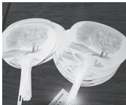
当日配布されたうちわの裏面には歌詞が書かれています