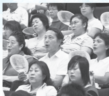
皆さんに歌われてこそその「さくら市の歌」です！