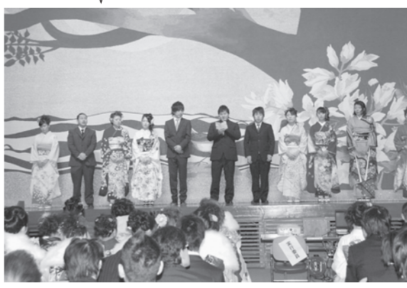
昨年度の成人式実行委員の皆さん