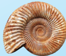
貝の化石ペリスフィンクテス