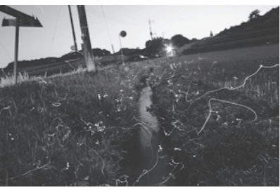
上河戸地区で撮影（2008年）

皆さんが知っている場所がありましたら、企画課広報係（☎681-1113）まで、ぜひお知らせください。皆さんからお教えいただいた場所は、できるだけ広報でお知らせしたいと思います。