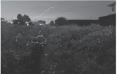
上松山地区で撮影（2007年）

ホタルが飛ぶのは、きれいな水があるところ…。6月中旬になると市内のいくつかの場所で、ホタルの飛散が確認されていますが、水がきれいなさくら市なら、意外な場所にもホタルがいるのでは！？