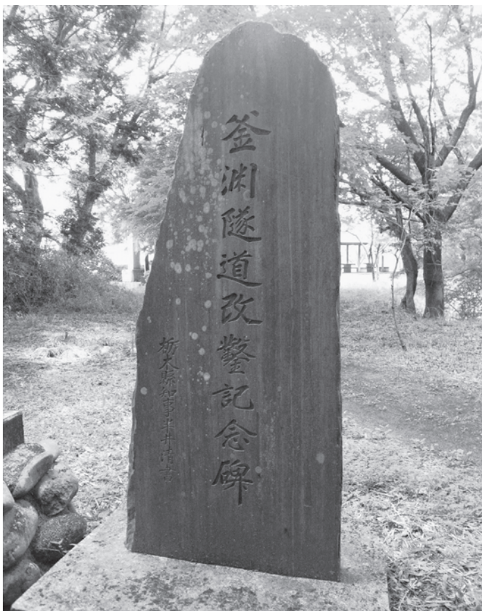
昭和9(1934)年 釜ヶ淵用水改鑿記念碑 (勝山城本丸跡内)

絶え間なく襲う洪水と、たび重なる復旧工事は、水利組合を持たない釜ヶ淵用水にとってその維持は困難を極めた。昭和一七年にようやく普通水利組合の設立をみるも、戦中のさなか、堅固な用水堰の設置はほど遠く、市の堀・草川用水の完備と比べ、ひとり取り残され用水の安定にはさらに時間を要することとなる。