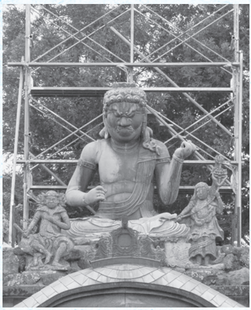
青銅造 不動明王坐像 昭29年9月7日 県指定 光明寺蔵

光明寺にある青銅造不動明王坐像は1759（宝暦9）年に宇都宮市の御用鑄物師戸室卯兵衛によって制作され、再来年の平成21年で鑄造250年目を迎えます。