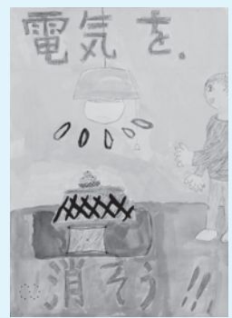
さくら市立小学校 4年生の作品

☎673-9101 http://homepage3.nifty.com/tochiondan/