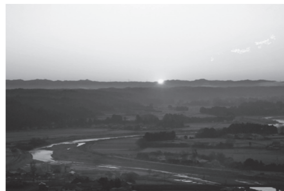
スカイタワーからの初日の出(平成20年)

【料金】中学生以上 300円 小学生 150円 【問】施設管理課 ☎686-6612