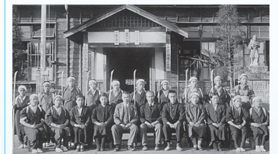
上江川村第一国民学校(昭和20年頃)