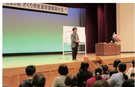
生涯学習振興大会