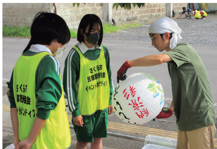
ユースボランティア