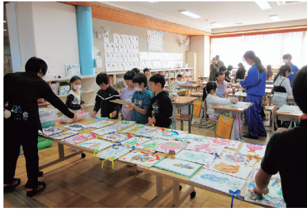
地域学校協働活動