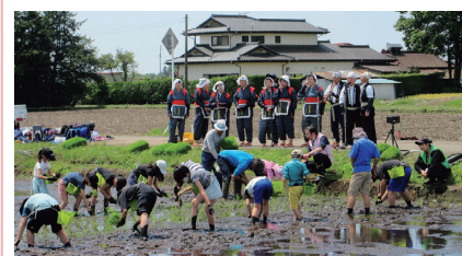
青少年センター 田植え体験