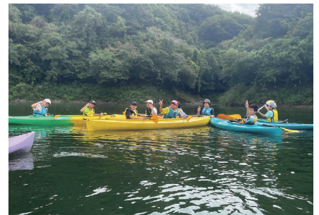
青少年センター体験活動