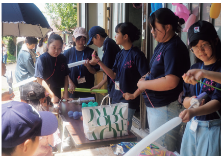
さくらリーダーズクラブ