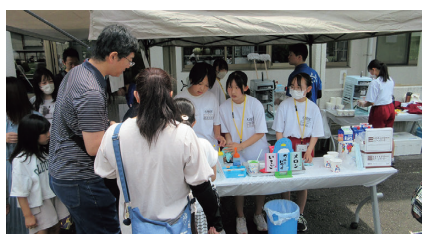
子育てハッピーデー