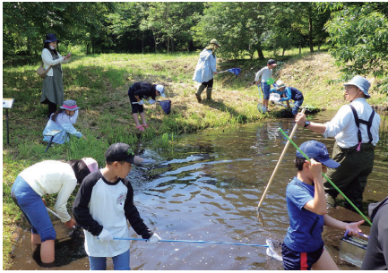
企業と連携した自然里山体験