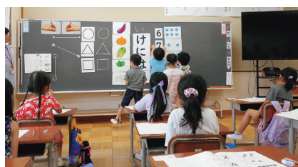
おもしろがっこう