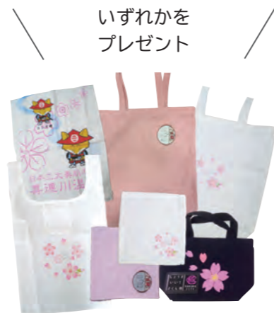
いずれかをプレゼント