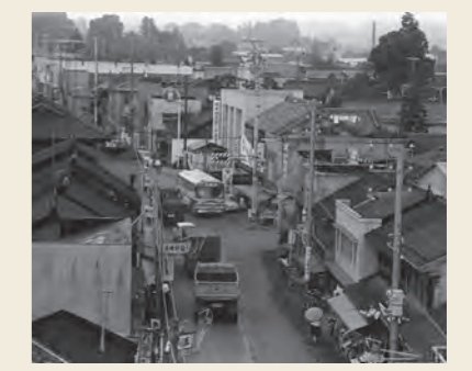
氏家市街地の旧国道四号線と上町四つ角(1965(昭和40)年ごろ)▲