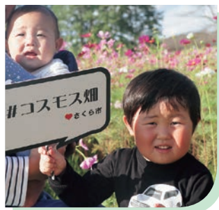
はるくんあつくん (2021年5月生まれ、2024年12月生まれ)