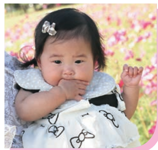
ふゆかちゃん (2024年12月生まれ)