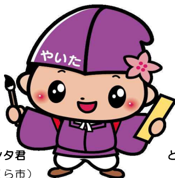
ともなりくん (矢板市)