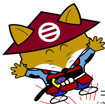
コンタ君 (さくら市)