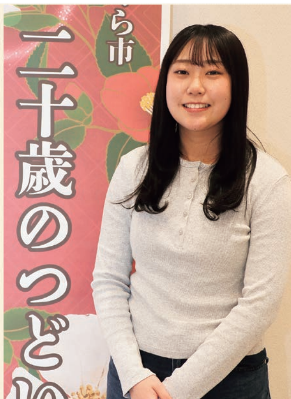
第4回さくら市二十歳のつどい 実行委員長