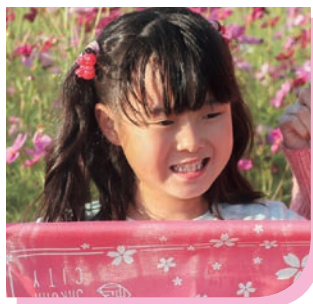
ことみ 琴海ちゃん (2018年5月生まれ)