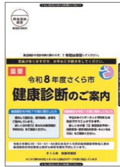
各個人宛て送付(A4 サイズ)▲