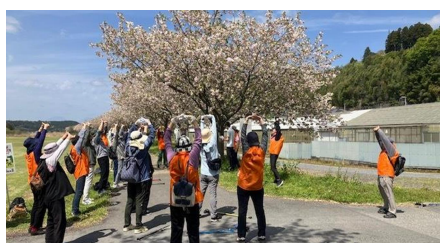
ウォーキング写真