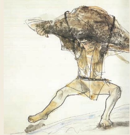
「絵本うじいえ昔ばなし」より

今回は、この「でいでん坊」を題材にした、巨大な造形作品も展示しています! ぜひ会場をご覧ください。