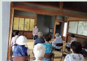
過去のお話会の様子▲