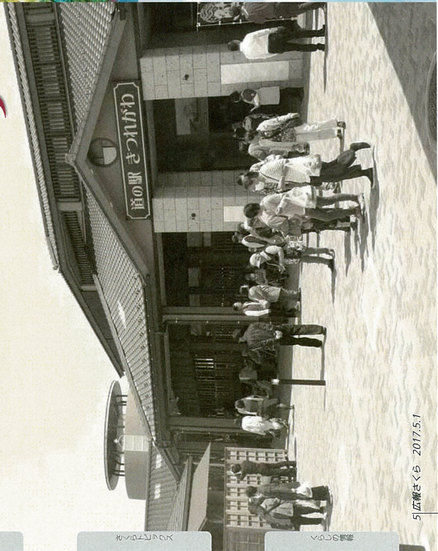
大正浪漫にひたりませう (1) 大正浪漫にひたりませう