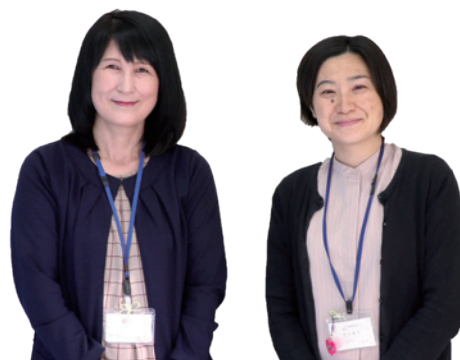
▲ 相談窓口のひとつ基幹相談支援センター等の相談員