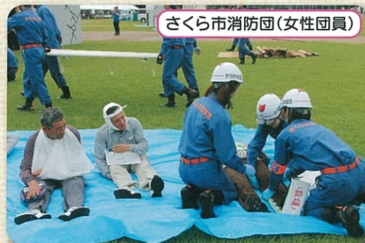
さくら市消防団(女性団員)

私たち男女共同参画推進委員会は、「男女共同参画の視点にたった防災」をテーマとして、展示ブースで「男女共同参画の視点で取り組む 防災ハンドブック(栃木県・(公)とちぎ男女共同参画財団発行)」の配布を行いました。その他、さくら市のハザードマップや災害時の写真の展示(東日本大震災(お丸山の様子や小中学生の松の植樹の様子など)、熊本大地震、常総市の水害、さくら市の水害の様子など)も合わせて行いました。