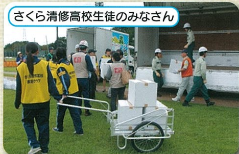
さくら清修高校生徒のみなさん

災害はいつ起こるかわかりません。災害備蓄品の有効利用を考えた保存方法(ランニング備蓄)、調理方法を知り、身近なところから緊急時に備えるのはもちろん、日頃から家族や地域で防災について話し合っておくことが大切だと感じました。