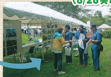
さくら市男女共同参画推進委員会展示ブース

平成28年8月28日(日)さくら市総合公園を会場に行われた栃木県・さくら市総合防災訓練に参加しました。