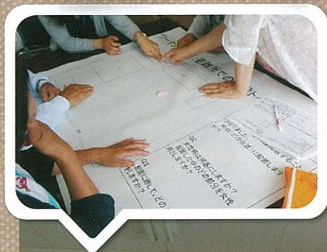
市男女共同参画推進委員会主催の防災研修を行いました。栃木テレビでもその様子が放映されました。