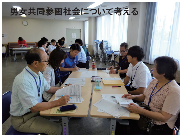
男女共同参画社会について考える

第2回のミーティングでは、栃木県主催男女共同参画スキルアップ講座のファシリテーション講座に参加しました。さくら市内外の男女共同参画推進委員と交流しながらファシリテーション（会議進行力）の基礎を学ぶことが出来ました。