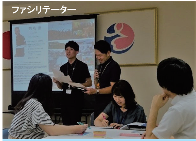
ファシリテーター

2人組を作り互いにインタビューをし合い、その結果得られた情報をもとに、自分のパートナーを参加者全員へ紹介するミニゲームを行いました。制限時間30秒は意外と短く感じました。また、お互いの意外な一面を知ることができました。