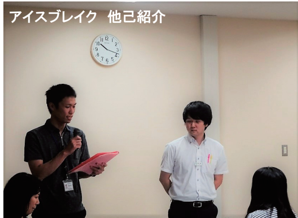
アイスブレイク 他己紹介

2人組を作り互いにインタビューをし合い、その結果得られた情報をもとに、自分のパートナーを参加者全員へ紹介するミニゲームを行いました。制限時間30秒は意外と短く感じました。また、お互いの意外な一面を知ることができました。