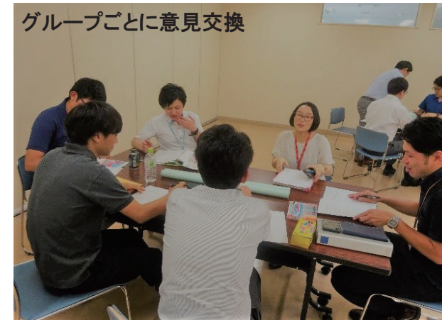
グループごとに意見交換