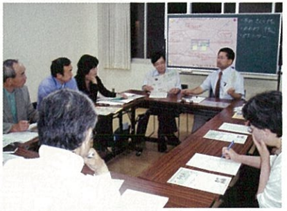
さくら市青少年センター 少年指導員会 広報啓発班

私たち少年指導員も、各団体と連携し各種イベントを企画しています。 本誌についてご提言等ございましたら、ご意見お聞かせください。 私たちと一緒にさくら市の子どもたちをみんなで育てましょう。