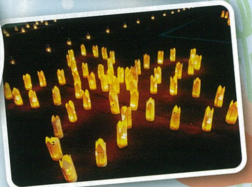
さくら清修高校ボランティア活動の写真