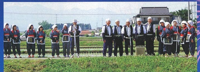
野州田植唄保存会の皆さんの「田植唄」実演