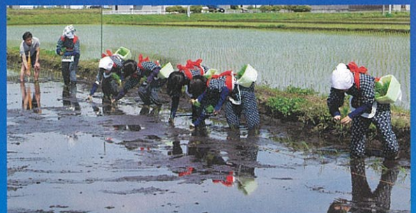
早乙女姿のさくら清修高校ユースボランティア