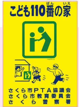
この看板が目印です

子どもたちが安全・安心に生活できるように、さくら市でも学校・地域・行政が一体となり、様々な取り組みを行っています。