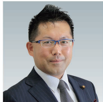
福田 克之 議員