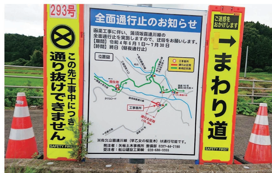
設置された県の予告看板

A 工事にあたって、予告看板の設置や市の広報紙への掲載に加え、地元行政区への回覧、学校などへ周知し、通行規制の内容や迂回路の案内などを行い、できる限り多くの方に周知できるよう取り組んでいる。また、その他の地域や市外の方々には、予告看板を設置して周知し、さらに市は広報紙やホームページ、LINE等のSNSを活用する。交通量が多い県管理の国道や県道については、事前に分かりやすく周知できるよう、連携して取り組んでいく。