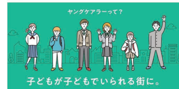
厚生労働省ホームページ( https://www.mhlw.go.jp/young-carer/ )