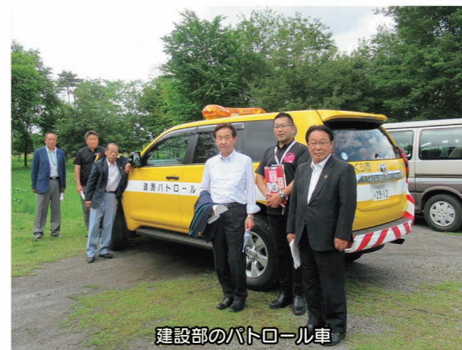
建設部のパトロール車