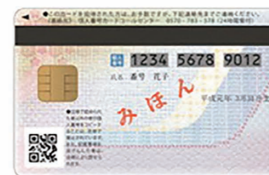
【うら面】 マイナンバーカード