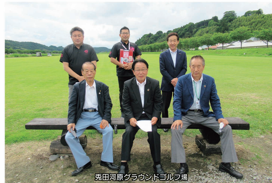
兔田河原グラウンドゴルフ場