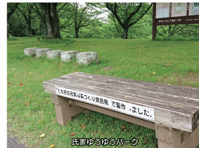
氏家ゆうゆうパーク

要望：今回の現地調査において、ベンチの不足が明らかになった。今後、必要とされる場所に合った新たなベンチの設置を。