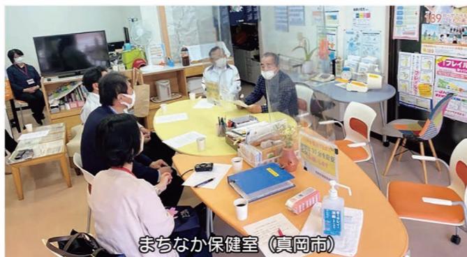
まちなか保健室(真岡市)

A 年度内設置に向けて準備を進めたい。運営にあたり、既に設置されている子育て、健康、福祉、高齢者の介護や、保険医療など、各相談機関のこれまでの活動や課題を整理した上で情報共有をして、連携強化を図りながら、地域の課題解決と地域住民を支援する体制を構築したい。