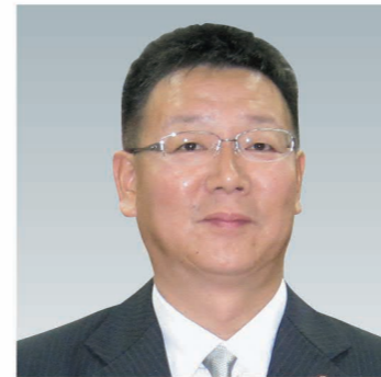
永井 孝叔 議員

A 県と連携の下で、本市の人権擁護委員や男女共同参画推進委員、※LGBTQに関するNPO団体、社会を明るくする運動等と共同して普及啓発に努めながら、パートナーシップ宣誓制度を導入し、誰も取り残さない、誰もが安心して住めるさくら市を実現したい。