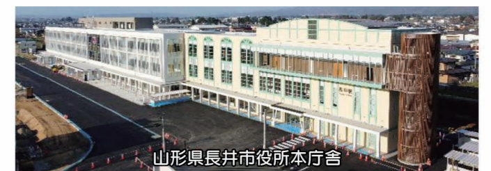
山形県長井市役所本庁舎

A 令和3年度末時点での庁舎建設基金の残高は3億6,100万円で、直近2年間では、令和2年度に1億円、令和3年度に2億900万円を積立てしている。今後も継続的な基金積立てを行い、建設時に過度な負担とならないよう計画的な資金の確保に努めたい。