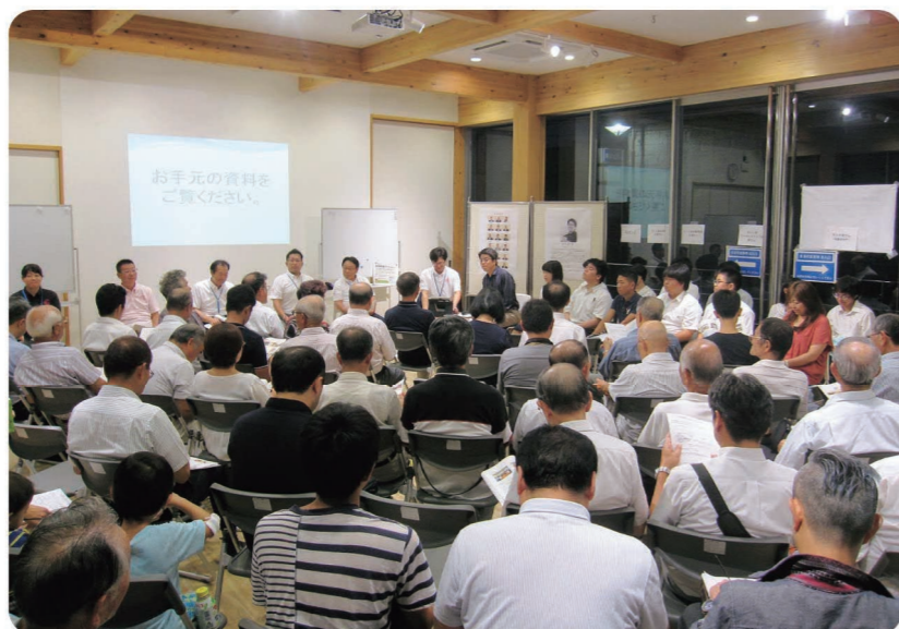
2019年の議会報告会の様子（さくらテラス）