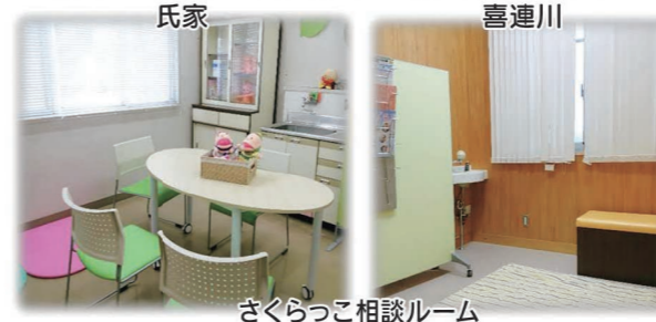
さくらっこ相談ルーム