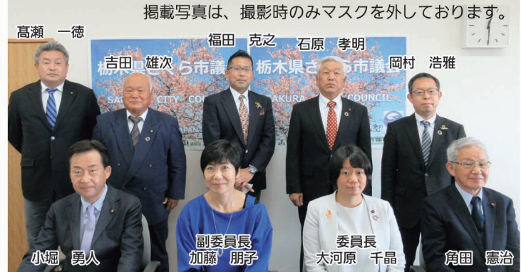
掲載写真は、撮影時のみマスクを外しております。