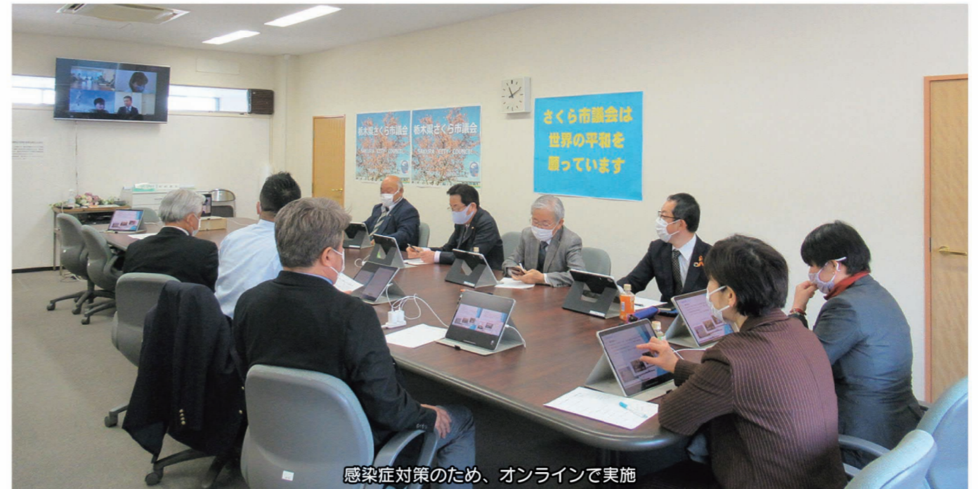
感染症対策のため、オンラインで実施