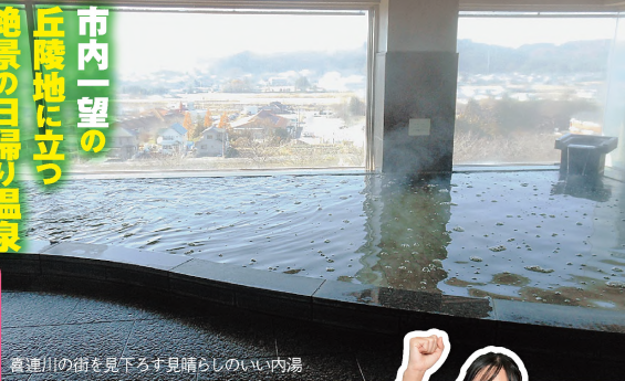
喜連川の街を見下ろす見晴らしのいい内湯

④さくら市喜連川15633 ⑤東北自動車道矢板Cから車で18分 ⑥入浴500円 ⑦10〜20時(入湯は〜19時) ⑧水曜(祝日の場合は営業) ⑨P100台