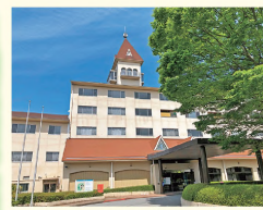
①三角屋根の塔が目印