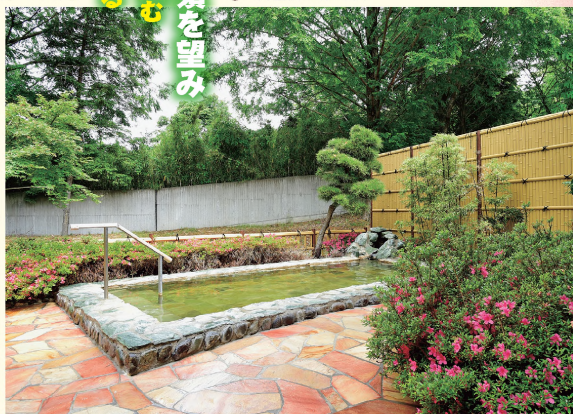
②木立に囲まれた露天風呂。自然を感じながら美肌の湯を満喫できる