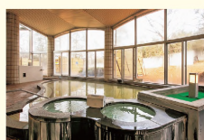
①大浴場は天井が高く、窓も大きいので開放感にあふれている