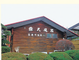
①道路から奥まった所に立つログハウス風の建物

1981年に湧出した硫黄・塩分・鉄分を多く含む良泉。嬉野温泉・斐乃上温泉とともに「日本三大美肌の湯」を標榜し、魅力発信に取り組んでいる。今回、さくらメイツにおすすめの日帰り湯や温泉宿を教えてくださいました。