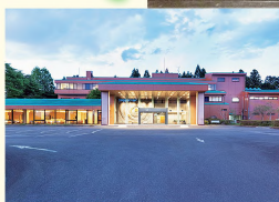
①桜の名所のお丸山公園エリアにあり、レストランは日帰りの人も利用可能