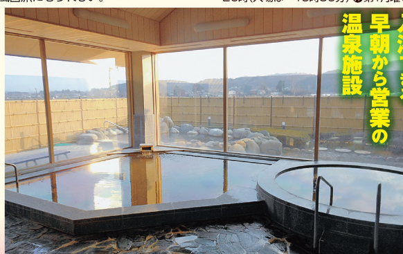
④開放的な浴室には、湯温の異なる高温・低温槽の2つの浴槽が並び

☎さくら市喜連川116620-1 ☎東北自動車道矢板ICから車で16分 ☎入浴300円(休憩施設利用は+300円。*休憩施設のみ利用不可) ☎7~20時(入場は~19時30分) ☎第1月曜 ☎100台