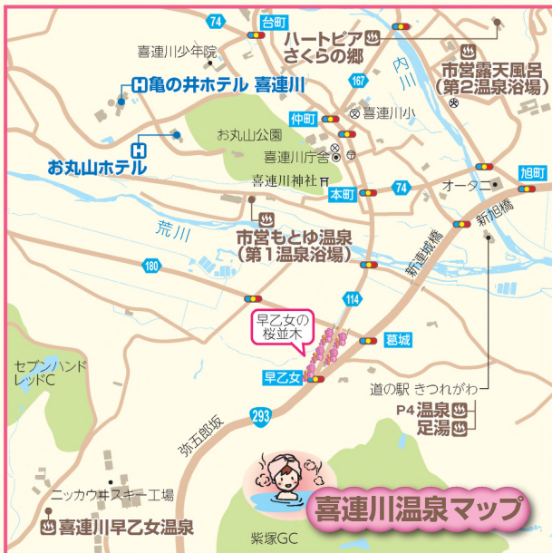
喜連川温泉マップ