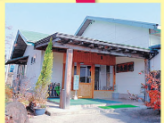
荒川沿いの高台に立地するリピーターが絶えない湯宿