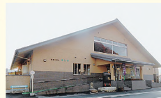
③荒川のほとりにあり、入浴後に散歩するのも気分がよい

内湯と岩風呂の露天風呂を備えた清潔感のある浴室には、山並みを望む大きな窓もあり、開放的な雰囲気。朝7時からの営業で、朝風呂派にもうれしい。