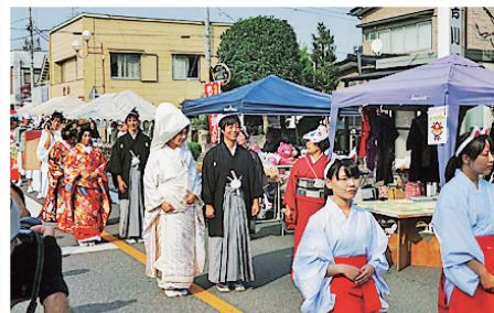
①キツネ化粧の新婚カップルに沿道から声が掛かる

喜連川の名の由来になった「きつね川」伝説にちなむ祭り。キツネの化粧をした新郎新婦が結婚式を挙げ、着物姿の参列者(申し込み自由)とともに商店街を歩く。