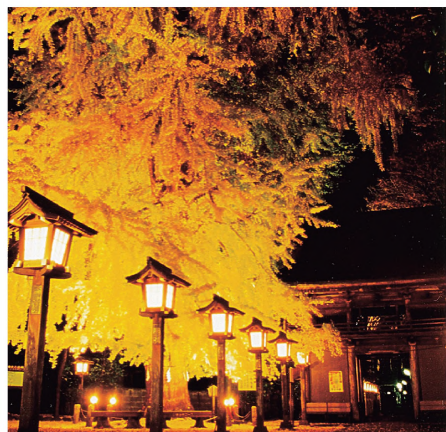
①今宮神社の歴史とともに成長した大イチョウ

今宮神社の境内に立つ高さ25m、樹齢700年の大イチョウはさくら市指定天然記念物。黄葉時期の夜間には、祭りに合わせて1週間ほどライトアップが行われる。