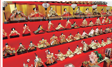
①毎年人形が変わる三角雛段

商店や公共施設、個人宅などのお飾り処は約50カ所。江戸時代から平成までさまざまな時代の雛人形を展示。