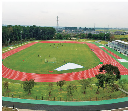
①大会のスタート&ゴールのさくらスタジアム

「さくらスタジアム」を起点に行われるマラソン大会は、1kmからハーフマラソンまで4コースがあり、家族で参加できる。田園地帯や市街地の中を、見晴らしのいい景色を楽しみながら走れる。完走者には記録証を配布。