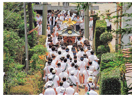
①その激しさから県内ではあばれ神輿として知られる

450年以上続く祭り。16時ごろから喜連川神社の神輿が勢よく町中を練り歩き、後を追うように神主や天狗、武士に扮した百物揃いの行列が続く。