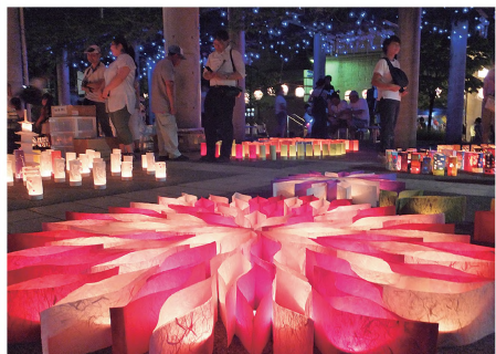
①夜は創作灯ろうが美の競演を繰り広げる

屋はダンスパフォーマンスやなつかしの遊び場を開催。縁日風のデントショップも。夜には市民ら手作り創作灯ろうが広場を彩る。