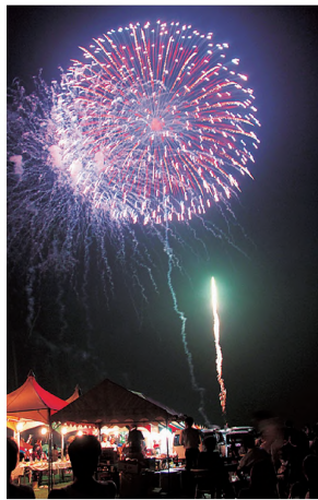
①花火は道の駅敷地内や水辺公園で見物できる

屋は特設ステージで抽選会やミニライブを開催。夜には河川敷から豪華尺玉を含め約5000発の花火が打ち上げられる。