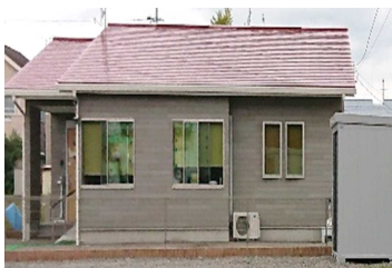
ちびっこランドさくら園 住所 さくら市草川3-66-12 TEL 028-666-5678