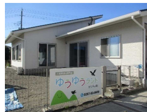
ちびっこランド那須烏山園 住所 那須烏山市南大和久473-24 TEL 0287-83-8600