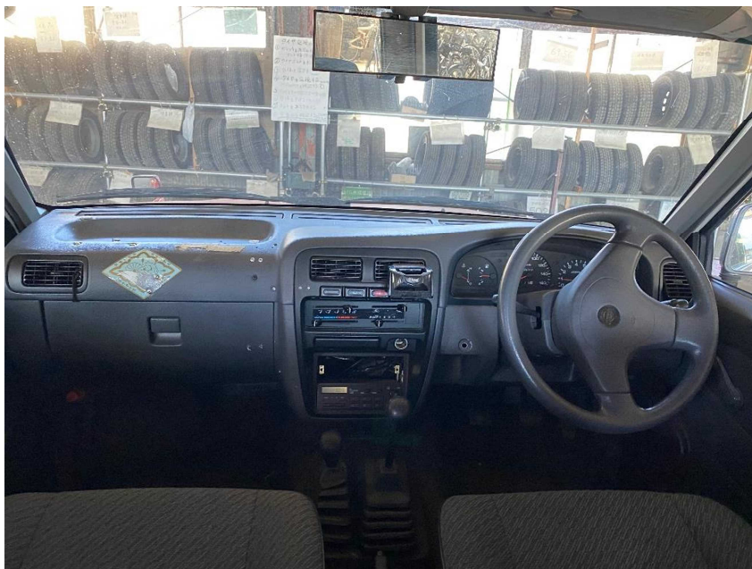
・内装（運転席・助手席）