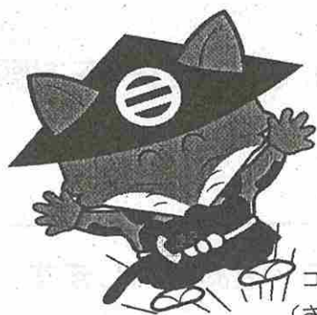
コンタ君 (さくら市)