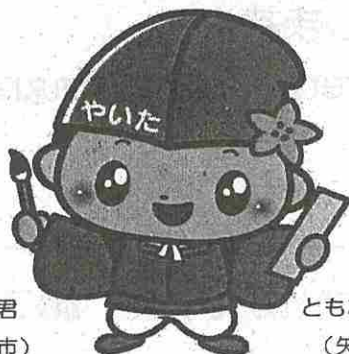
ともなりくん (矢板市)